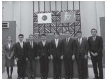
議会広報特別委員