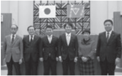
建設産経常任委員