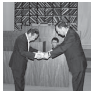
表彰状を授与される加藤政勝議員