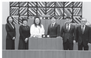
議会ICT化推進特別委員