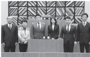
議会広報特別委員