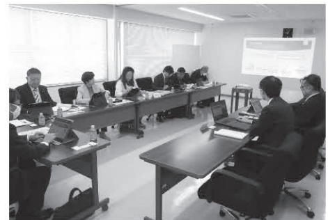
柴田町で調査する委員

岩沼市議会においても、タブレット端末のさらなる有効活用について、各議員がツールとして当たり前に使いこなせることを目指し、貸与されている端末をフル活用できるように認識を持つことが大切だと思う。改選後は、より一層ペーパーレス化を進め、議員間の情報伝達手段としても使いこなせるよう、柴田町議会の先進的な取組をさらに深め生かすべきと考える。