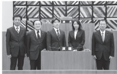
教育民生常任委員