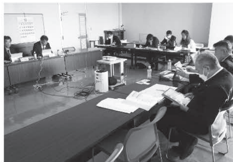
登米市で調査する委員

アプリケーションソフトを導入して議会事務局と議員との連絡や通知、情報共有などの活用方法も検討し、改選後は、タブレット端末をより一層生かしながら、各議員の習熟度も異なることを考えながらのルールづくりが必要と考える。