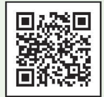
岩沼市議会映像配信

岩沼市議会のホームページや質問を行った議員のQRコードからアクセスできます。 平成30年12月定例会までさかのぼり、過去の本会議を見ることができます。