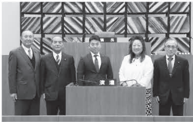
建設産経常任委員